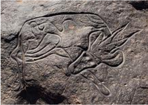
Sud Europe – Bovidé couché