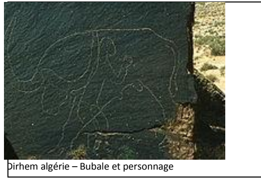
Dirhem algérie – Bubale et personnage

-Félicitations. Vous voulez donc démontrer que la Maghreb et la France était dans le même continent ?