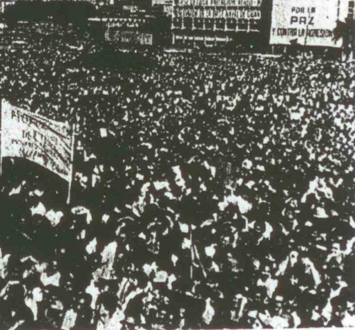
NI « encadrement », ni « quadrillage ». Les masses conscientes de leur force et de leurs objectifs sont constamment mobilisées, prêtes à répondre à tout appel, car cette « mobilisation » se fait sur la base démocratique. NOTRE PHOTO : Des centaines de milliers de Cubains sur la place Jose Marti, de La Havane, en un meeting de protestation contre l'agression yankee

M. Ousseidk a ensuite évoqué les efforts que fournit actuellement l'Algérie pour sa reconstruction et l'édification du socialisme. Il s'est félicité du développement des liens bulgarno-algériens, ajoutant qu'il ne ménagerait aucun effort pour que la coopération en-