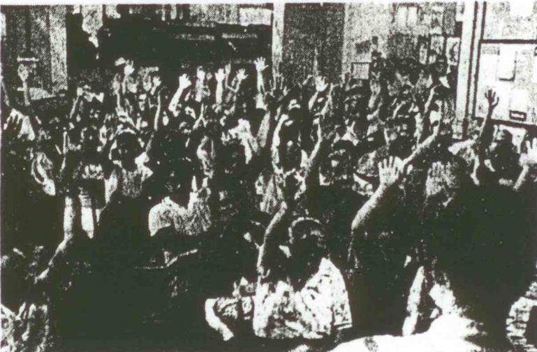
Ne rien faire qui ne soit l'expression de la volonté des travailleurs, agir avec leur accord : c'est là la démocratie telle que la conçoivent les révolutionnaires cubains. NOTRE PHOTO : Des travailleurs d'une entreprise votent pour approuver la proposition de l'un des leurs pour un poste de responsabilité.

constructives et de l'expérience réciproque.