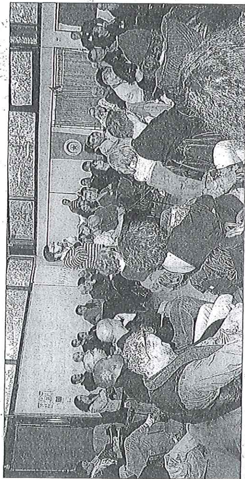
▲ A l'issue des interventions, les échanges ont été nombreux avec la salle. ▼ La première journée a débuté par une table ronde ayant pour thématique "le racisme comme système".

portement des policiers dans les quartiers populaires n'est pas un hasard. Il est justifié par des discours officiels de légitimation de droite comme de gauche ». Quant à la thèse du racisme anti-blanc, « elle est n'est qu'une machine pour remettre en silence ceux