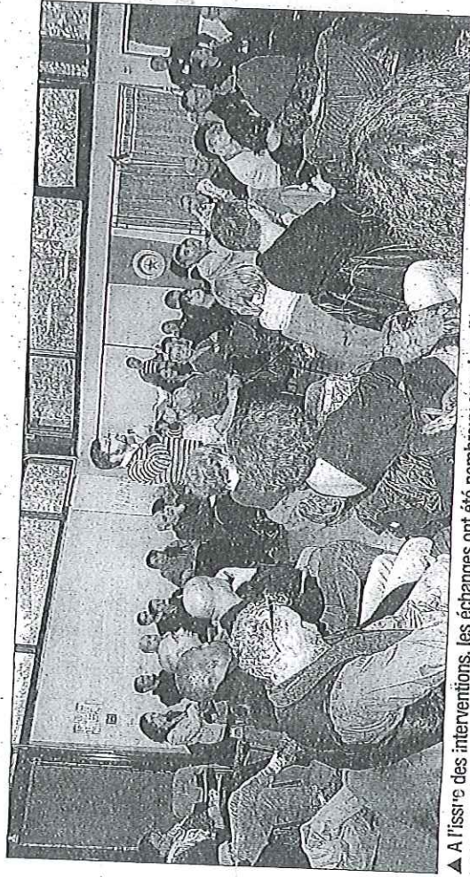
▲ A l'issue des interventions, les échanges ont été nombreux avec la salle. ▼ La première journée a débuté par une table ronde ayant pour thématique "le racisme comme système".

La première journée a débuté par une table ronde