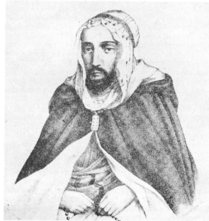
Portrait de l'Emir ABDELKADER dessiné à Tagdempt par MANUCCI

Il semble que nous ayons là le portrait le plus fidèle de l'Emir